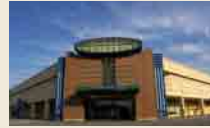
ファニチャーパーク K3