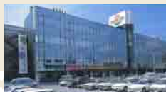
米三魚津店があったサンプラザ