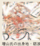
増山氏の出身地・砺波市