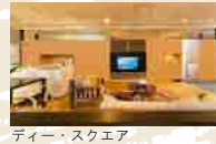
ディー・スクエア