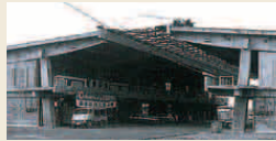
米三流通センター